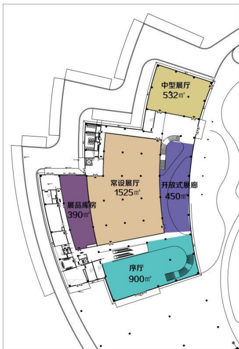
主展馆一层展厅布局图

本届园博会主展馆位于荆沙地方铁路以东，园博路以南，庙湖以西，邵家咀遗址以北。主展馆共两层，总建筑面积约 17000 m 2 ，室内展陈面积约 5000 m 2 （以图纸实际测量为准）。